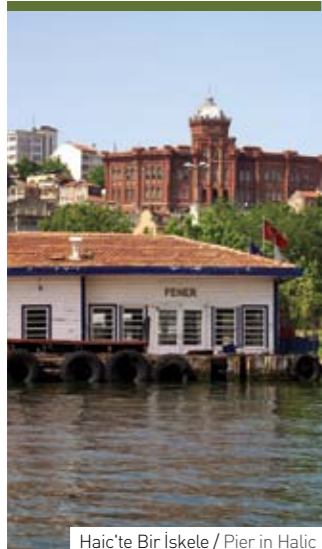
Haliç'te Bir İskele / Pier in Haliç