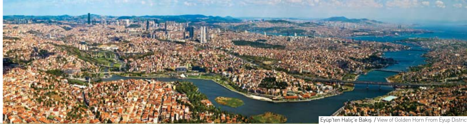
Eyüp'ten Haliç'e Bakış / View of Golden Horn From Eyup District

Türkiye'nin çekiciliğinde, lokasyon olarak Doğu ve Batı'yı birbirine bağlayan enerji koridoru özelliği taşımasının, birkaç saatlik uçuşla ulaşılabilir konumda yer almasının ve sahip olduğu tarihi ve turizm alanlarının etkisi büyüktür.