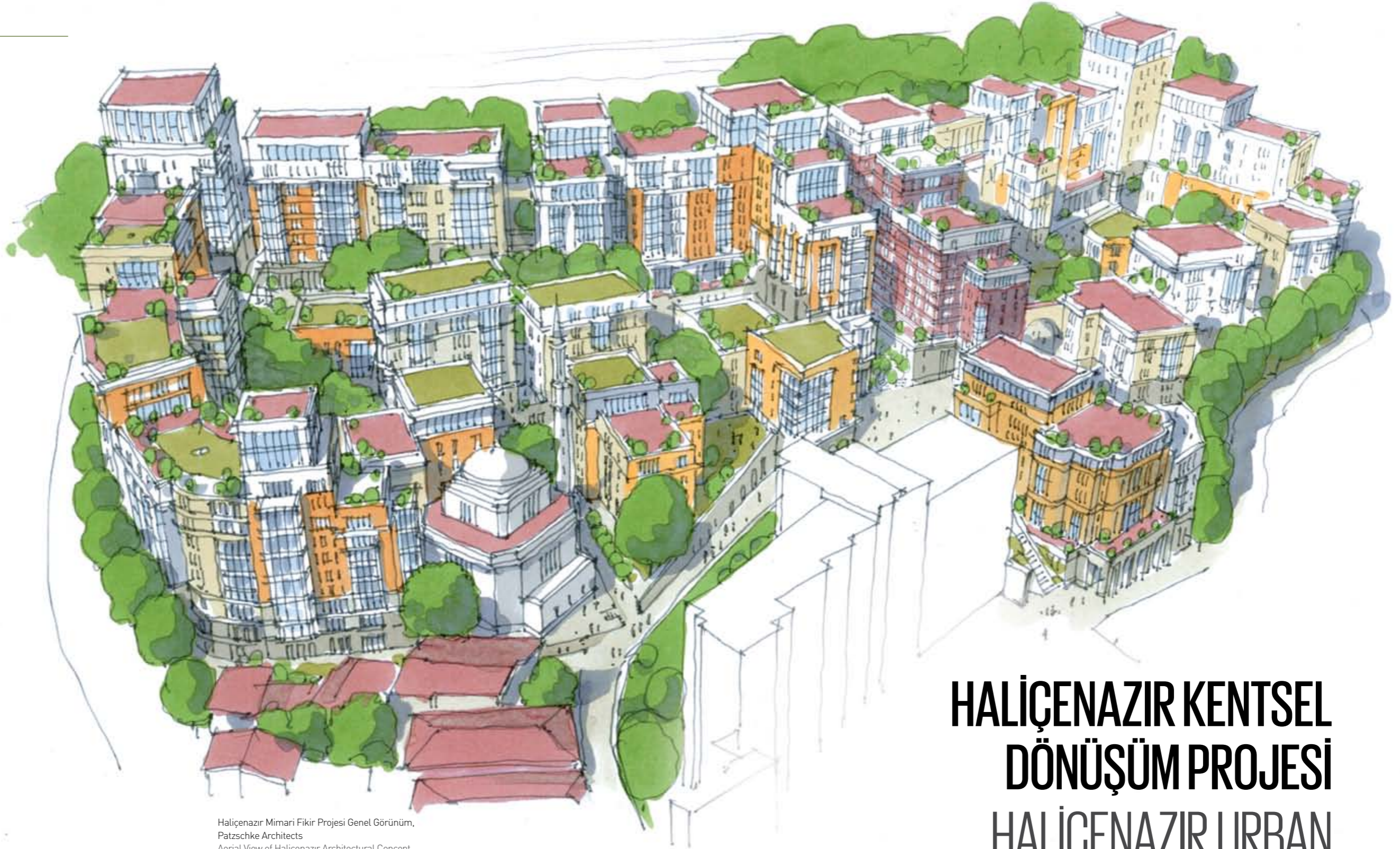
Halicenzir Mimari Fikir Projesi Genel Görünüm, Patzschke Architects Aerial View of Halicenzir Architectural Concept Project, by Patzschke Architects