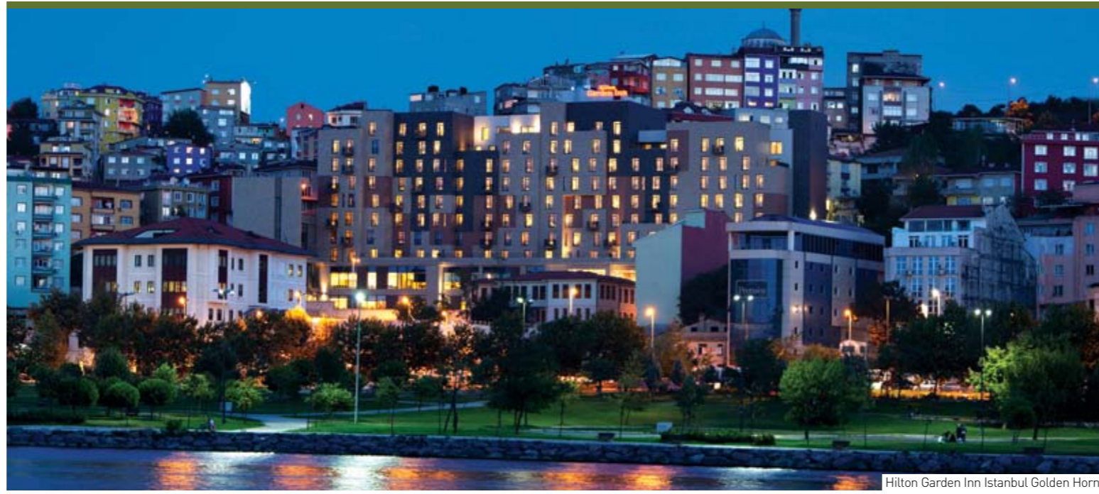
Hilton Garden Inn Istanbul Golden Horn

Yakın zamanda, çevresinde yapılması planlanan yeni tünel, tramvay ve teleferik projeleri bölgenin ulaşılabilirliğini daha da artıracaktır.