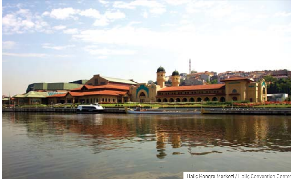
Haliç Kongre Merkezi / Haliç Convention Center