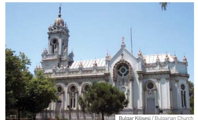
Bulgar Kilsesi / Bulgarian Church

Following the reveal of historical and touristic potential of The Golden Horn district, which is one of the oldest settlements of Istanbul, it was made a renowned cultural venue.