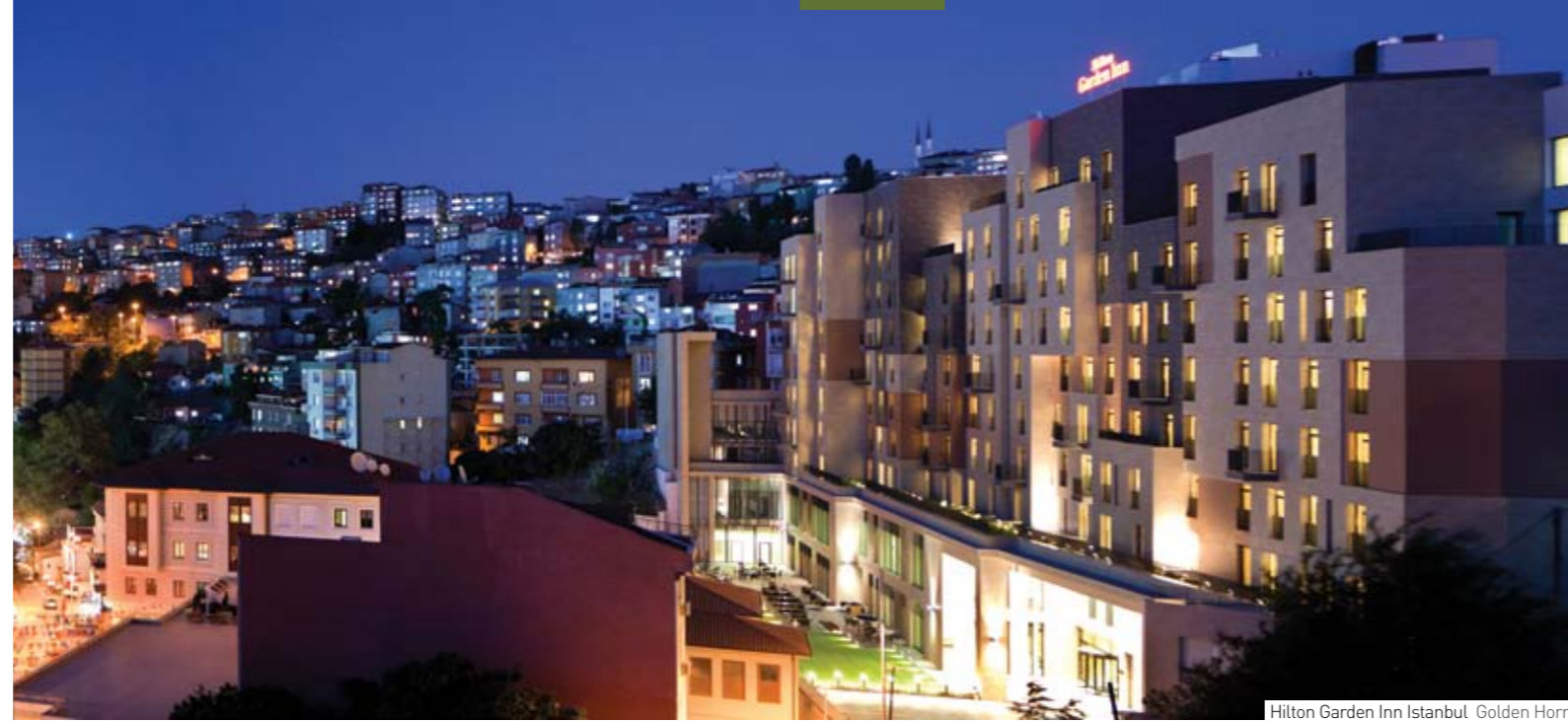
Hilton Garden Inn Istanbul Golden Horn

Amplio's concern about the environment and the nature has been acknowledged.