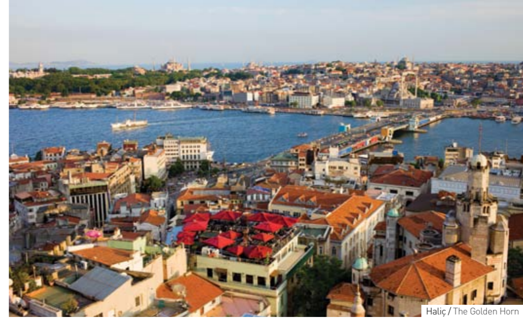
Haliç / The Golden Horn