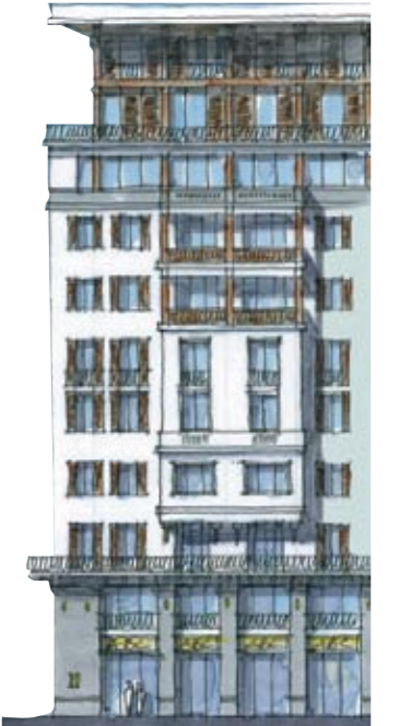
Bina Cephe Örneği, Patzschke Architects Sample of a Building Elevation, by Patzschke Architects

company cooperates with renowned national and international Architectural teams. Important teams such as Mar Architecture from Turkey and Patzschke Architects from Germany are working hard on this project.