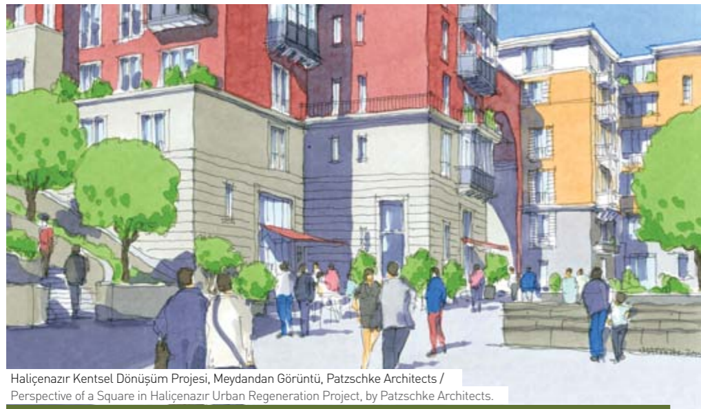
Haliçenazir Kentsel Dönüşüm Projesi, Meydandan Görüntü, Patzschke Architects / Perspective of a Square in Haliçenazir Urban Regeneration Project, by Patzschke Architects.

For the transformation process to be realized in the Golden Horn, Amplio, also integrates innovative practices and environmentally friendly production techniques that will ensure energy efficiency.