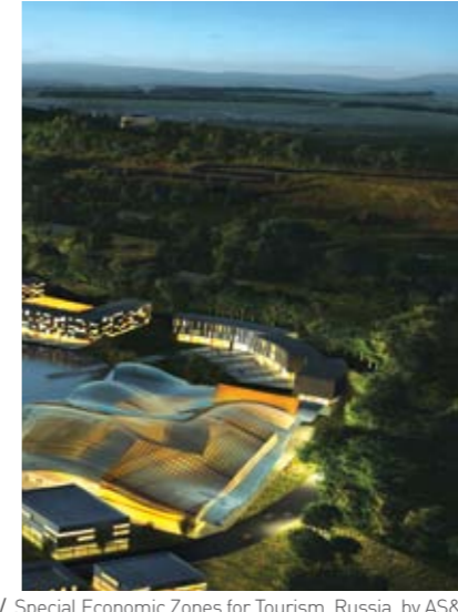
Turizme Yönelik Özel Ekonomik Bölgeler, Rusya, AS&P / Special Economic Zones for Tourism, Russia, by AS&P

Amplio, Haliç Sötlüce bölgesinde pilot kentsel dönüşüm projesini büyük bir hassasiyetle yürütmektedir. Ancak, Haliç havzasının bütün olarak bir değer olduğunun ve bütüncül yaklaşılması gerektiğinin de farkında ve bilincindedir.