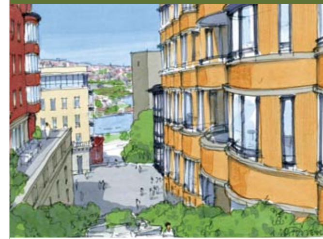
Haliçenazir Kentsel Dönüşüm Projesi Açık Mekan Görüntüleri, Patzschke Architects / Perspectives of Open Spaces in Haliçenazir Urban Regeneration Project, by Patzschke Architects.

Amplio, Haliç'te gerçekleştireceği kentsel dönüşümde aynı zamanda enerji tasarrufu sağlayacak yenilikçi uygulamaları ve çevreci enerji üretim tekniklerini projeye entegre etmektedir.