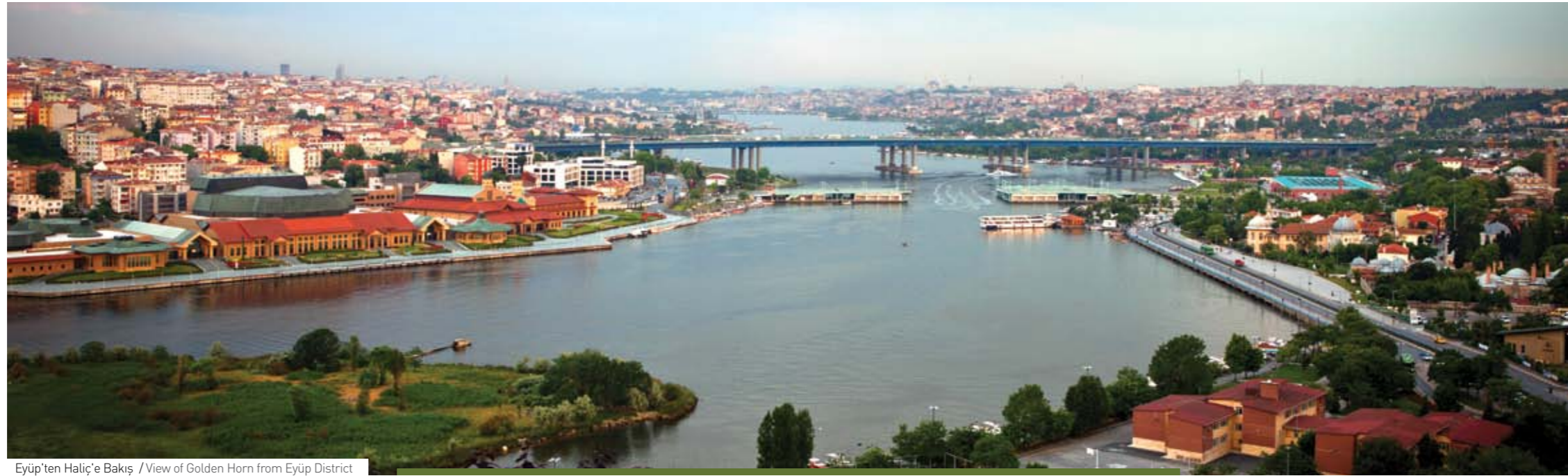
Eyüp'ten Haliç'e Bakış / View of Golden Horn from Eyüp District

18. yüzyılda İstanbul'un mekânsal gelişimi açısından en önemli özelliği, Boğaziçi ve Haliç'in organik bütünleşmesi olmuştur. Haliç, Osmanlı döneminde kıyılarındaki yemyeşil düzlükler ile dünyanın en verimli toprakları, her türlü balığın bulunduğu suları, en nadide deniz ürünleri ve bereketiyle ün yapmıştır. Sahip olduğu doğal güzellikleriyle, İstanbul'u gezen yabancı seyyah ve sanatçıların da büyük ilgisini çekmiştir. Hatta, ünlü yazar ve denizci Pierre Loti, yüzyıl önce sık sık Eyüp sırtlarında bulunan çay bahçesine geldiğinden buraya adı verilmiştir. Ayrıca, Haliç ve çevresinin tarihten gelen kimliği, bölgenin çok sayıda dini ve kültürel yapı ile zenginleşmesini sağlamıştır.