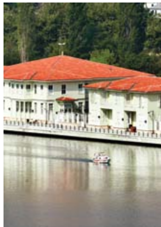
Bahariye Mevlevihanesi Bahariye Mevlevihane

Bilgi Üniversitesi, Kadir Has Üniversitesi, İstanbul Ticaret Üniversitesi, Fatih Sultan Mehmet Üniversitesi gibi üniversiteler ile Haliç Kültür ve Kongre Merkezi, Feshane, Miniatürk Açık Hava Müzesi, Eyüp Kültür Merkezi, Santralİstanbul, Milli Arşiv, Bulgar Kilisesi,