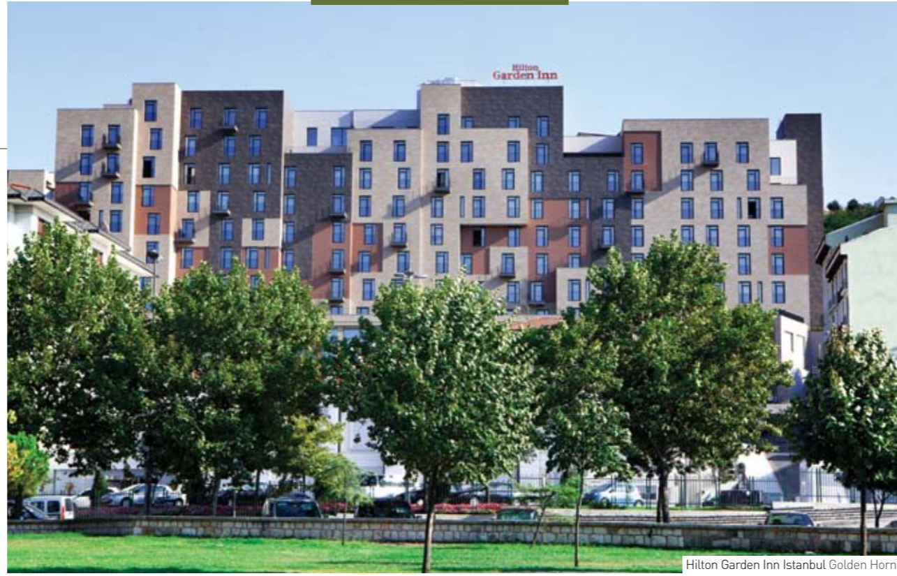
Hilton Garden Inn Istanbul Golden Horn

"Geri Dönüşebilen Otel: Hilton Garden Inn İstanbul Golden Horn, yerli teknolojiyle birçok ilke imza attı. Otelde tek bir yağmur damlası boşa gitmiyor, elektrik ise güneşten sağlanıyor." (Gözlem ek, 11.08.2012)