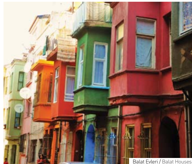
Balat Evleri / Balat Houses

Bugün Haliç'te yaklaşık 50 civarında balık çeşitliliği bulunmaktadır. Ayrıca Haliç çevresinde yer alan endüstriyel mekânların kültür merkezlerine ve müzelere çevrilmesi ile de kültür vadisinin temel taşları oluşturulmaya başlanmıştır.