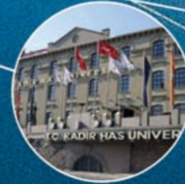
KADIR HAS ÜNİVERSİTESİ KADIR HAS UNIVERSITY