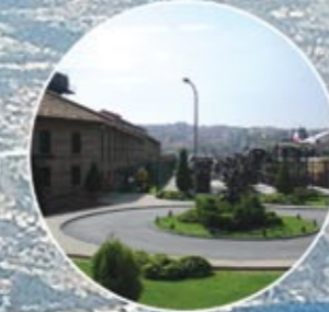
RAHİMİ M. KOÇ MÜZESİ RAHİMİ M. KOÇ MUSEUM