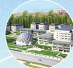
MİLLİ ARŞİV NATIONAL ARCHIVE