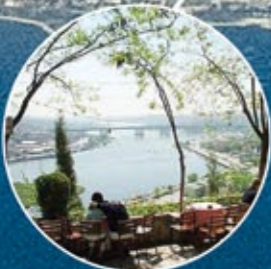
PIERRE LOTI TEPEŞİ PIERRE LOTI HILL