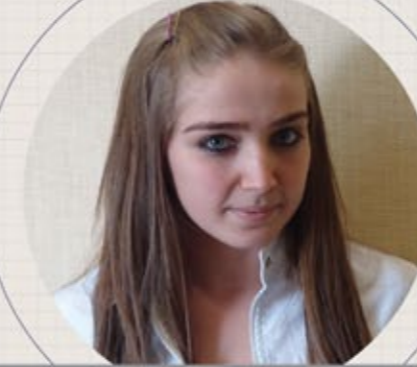
Yeşim Kader Ofis Yönetimi Office Management