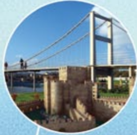
MİNİATÜRK AÇIKHAVA MÜZESİ MINIATURK OPEN AIR MUSEUM