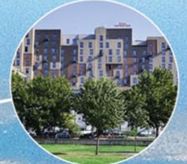
HILTON GARDEN INN İSTANBUL GOLDEN HORN HOTEL HILTON GARDEN INN İSTANBUL GOLDEN HORN HOTEL