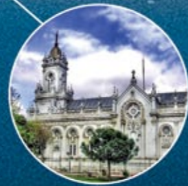
BULGAR KİLİSESİ BULGARIAN CHURCH