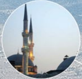
EYÜP SULTAN CAMİİ EYÜP SULTAN MOSQUE