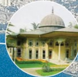
AYNALIKAVAK KASRI AYNALIKAVAK PAVILION