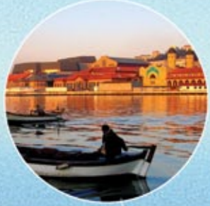
HALIÇ KONGRE VE FUAR MERKEZİ HALIÇ CONGRESS AND EXHIBITION CENTRE