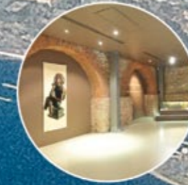
REZAN HAS MÜZESİ REZAN HAS MUSEUM