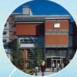
İSTANBUL BİLGİ ÜNİVERSİTESİ İSTANBUL BILGI UNIVERSITY