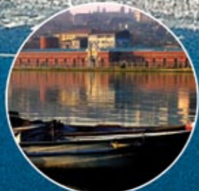
FESHANE ULUSLARARASI FUAR VE KONGRE MERKEZİ FESHANE INTERNATIONAL EXHIBITION AND CONVENTION CENTRE